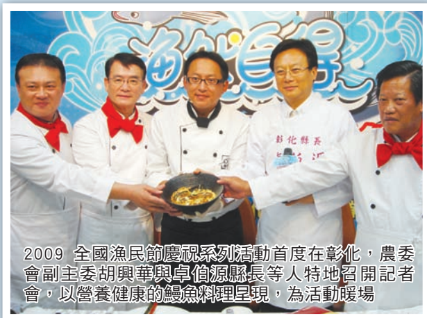
2009 全國漁民節慶祝系列活動首度在彰化，農委會副主委胡興華與卓值源縣長等人特地召開記者會，以營養健康的鰻魚料理呈現，為活動暖場