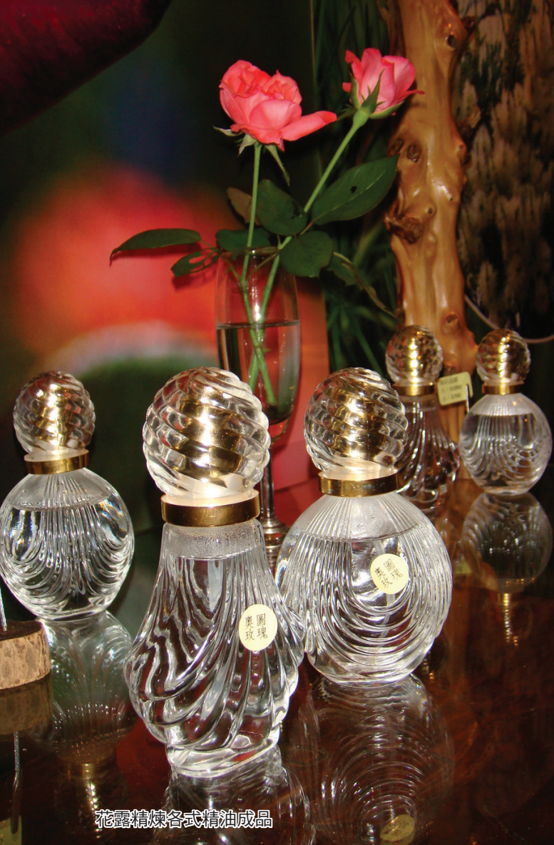
花露精煉各式精油成品

求、陸續增設咖啡雅座、田園餐廳，「花露」漸漸地從生產農場轉型，也帶動壩西坪休閒農業蓬勃發展。