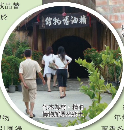
竹木為材，精油博物館風格鄉土