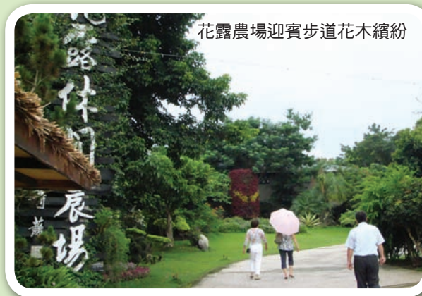
花露農場迎賓步道花木繽紛

相當多，僅純精油就有玫瑰草、月桂、羅勒、扁柏、苦橙葉、杜松果、花梨木、丁香花苞、尤加利、鼠尾草、迷迭香、薰衣草等數十種，還有沐浴乳、護髮乳、潔淨露、美容皂等延伸產品，選用萃取的香草植物陣容壯盛，當然少不了老牌的香茅草、樟樹。