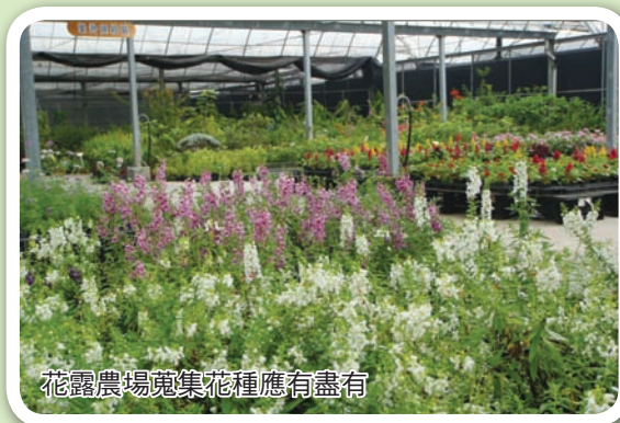
花露農場蒐集花種應有盡有