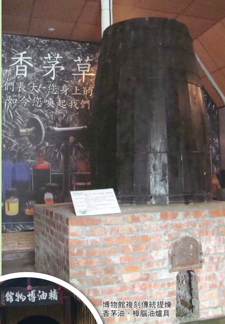
博物館復刻傳統提煉香茅油、樟腦油爐具

香草能量花園位於花露農場中心，面積不算大，高低錯落著豔紅、鵝黃、紫白等五彩繽紛的各式香草植物，淡雅、濃郁花香交織，品系多到難以細數，農場蒐集的花種，僅薰衣草就有20