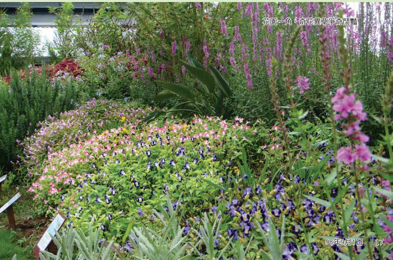
花園一角，奇花異草爭奇鬥豔