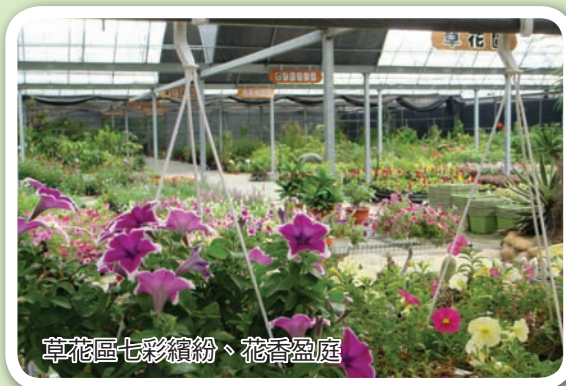
草花區七彩繽紛、花香盈庭