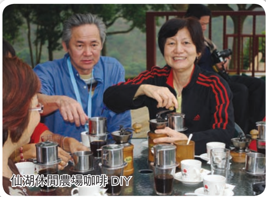
仙湖休閒農場咖啡 DIY

今年參展的休閒農場業者莫不絞盡腦汁出奇招，推出特色料理，包含山色美味、海景鮮食、田園美饌，現場可看到野菜、水果、竹筍、乳香等料理、原住民風味餐、海鮮創意料理等，讓人驚喜台灣農產的豐富多樣；而除了田園風格的布置，還有吸睛的小雞、稻草扎成的牛，吸引不少圍觀民眾拍照。