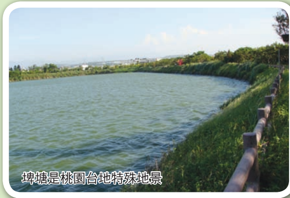
埤塘是桃園台地特殊地景