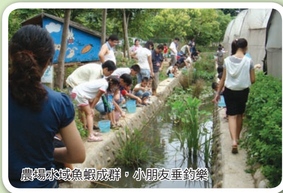
農場水域魚蝦成群，小朋友垂釣樂