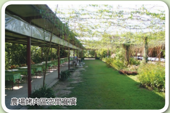
農場烤肉區空間寬廣