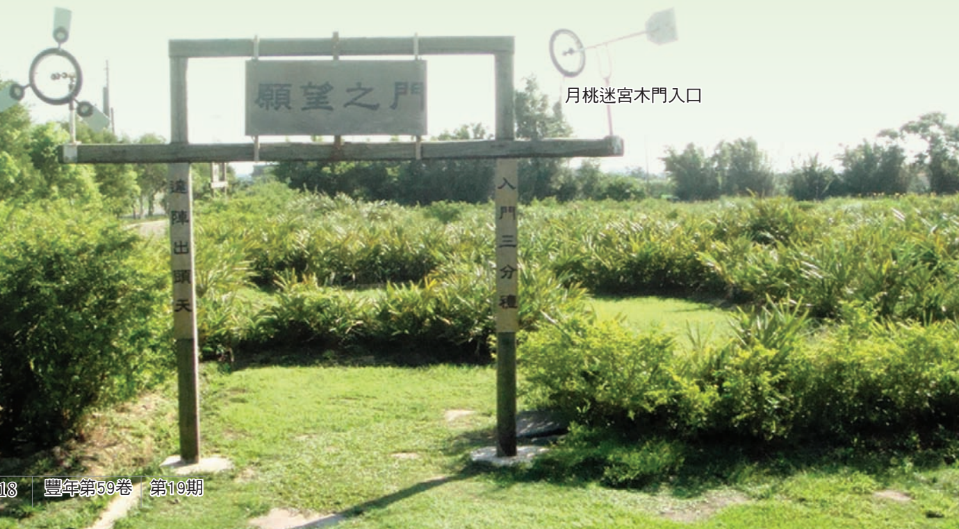
月桃迷宮木門入口