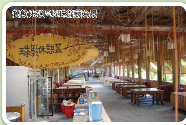
餐飲休憩區以珠簾藤為景

林，溝渠、水田裡隨處可見泥鰍、鱒魚、青蛙，但漸漸的，樹林稀落了，水中小動物消失了，化學藥物的廣泛使用，稻穀收穫量雖然增加，卻也付出環境生態被破壞的代價。