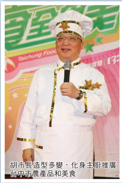
胡市長造型多變，化身主廚推廣台中市農產品和美食