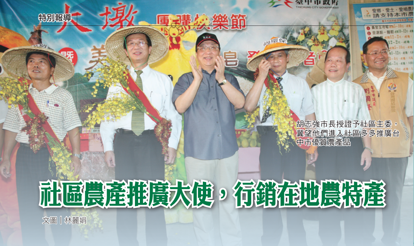
胡志強市長授證予社區主委，冀望他們進入社區多多推廣台中市優質農產品