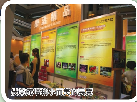
農業館堪稱小而美的展覽