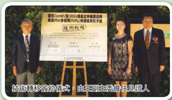
技術轉移簽約儀式，由王副主委擔任見證人

蛋生產免疫球蛋白，有效減輕病原之效果等多項與民眾生活息息相關之技術。此外，為促進農業技術落實產業應用，推動具發展潛力之農業科技成果，特針對「保健/保養機能性素材」及「農業檢測診斷試劑及技術」2 項主題辦理成果發表會，與業界人士共享研發新成果。