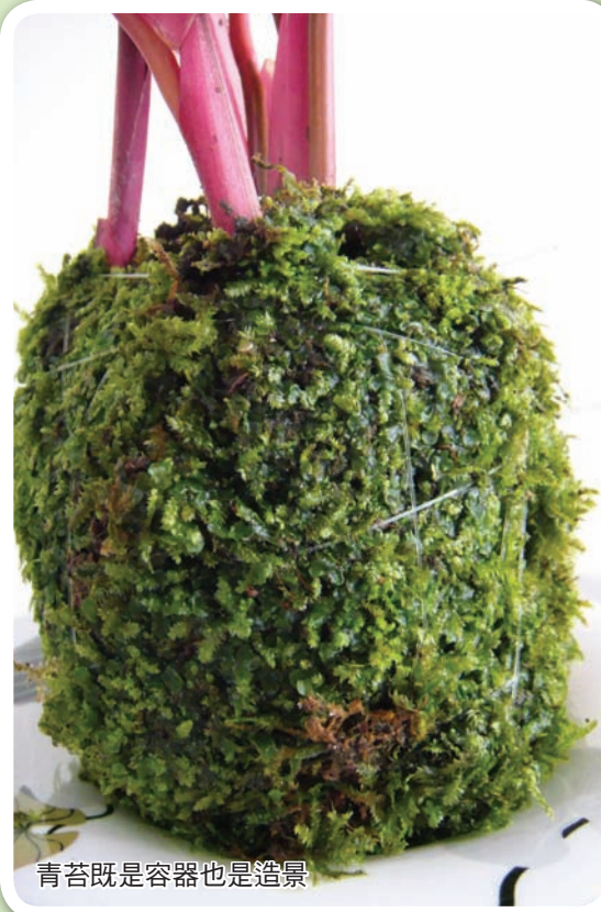
青苔既是容器也是造景