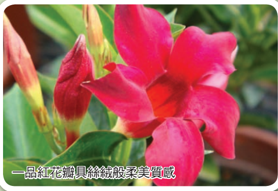
一品紅花瓣具絲絨般柔美質感