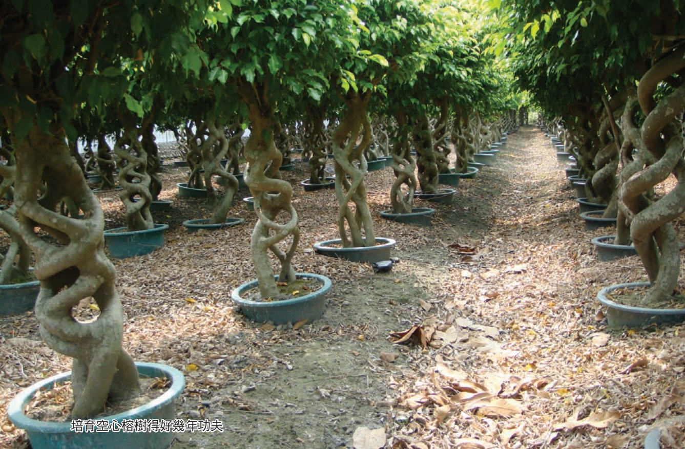
培育空心榕樹得好幾年功夫