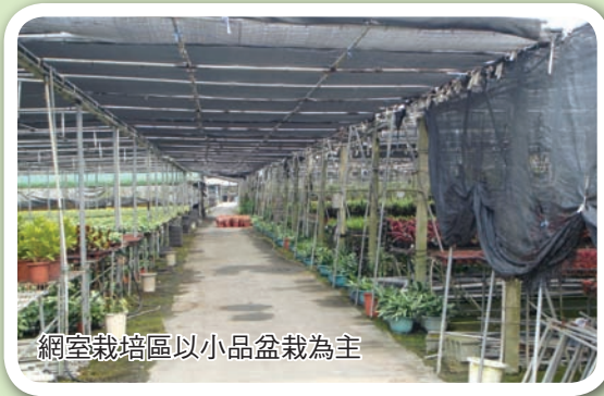
網室栽培區以小品盆栽為主

空心榕樹的難度不算特別高，但相當耗費時間，1 棵完美的空心榕樹，大約得花上 10 年功夫，人工雕琢的痕跡才消融於無形。