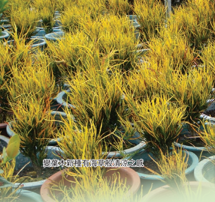
變葉木新種有海草般清涼之感