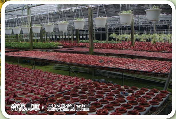
奇花異草，品系超過百種

較高、氣候涼爽的埔里盆地，盆花是其強項；桃園縣大園等鄉鎮，挾鄰近大台北都會區地利之便，發展小型四季草花；田尾則在庭院造景的中大型景觀樹種方面獨占鰲頭，另外如菊花、太陽花等切花也維持強勢地位。