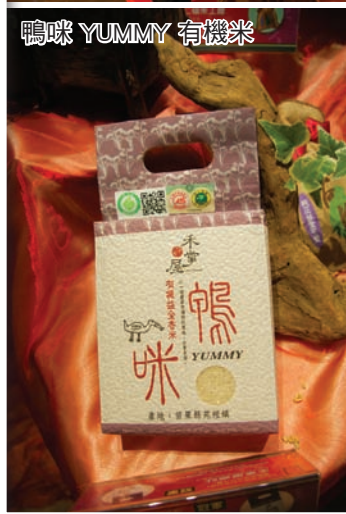
鴨咪 YUMMY 有機米

度，提供上市、上櫃企業、各級學校、行政機關、社團法人及一般消費者作為伴手禮品，達成「新鮮、品質、食健康」的目標。