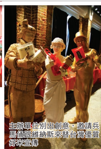
主辦單位別出創意，邀請兵馬俑跟維納斯來替台灣優質好米宣傳

主辦單位之一的桃園縣農會表示，為將北區良質米推向頂級精緻市場，包裝走向美學、復古、融入綠色環保等概念，透過各種媒體廣告：如設置北台灣良質米網