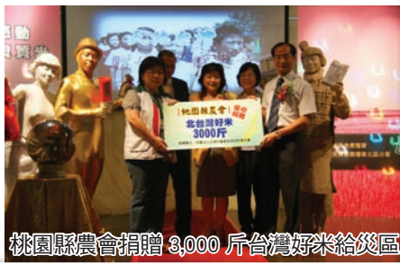
桃園縣農會捐贈 3,000 斤台灣好米給災區

路部落格、關鍵字廣告、平面媒體廣告及消息稿曝光、大眾運輸公車車身廣告加強宣傳行銷北區好米。另一方面，也與新光三越百貨股份有限公司台北站前等 4 家分店配合成立北台灣優質小包裝好米