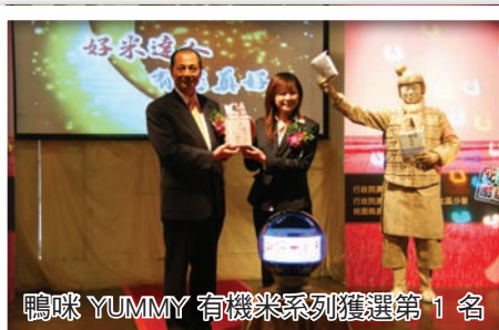
鴨咪 YUMMY 有機米系列獲選第 1 名

土情懷辛勞耕出的種種天然美味，不應繼續成為論斤論兩的微利商品。而奪得第3名的好的米食品有限公司說，「一穗一好米，粒粒皆好米」是公司經營的基本宗旨，全體員工秉持著實實在在的態度，以健康、自然、養生為導向，會不斷創新研發更美味的米產品，呈現給廣大的消費群眾。