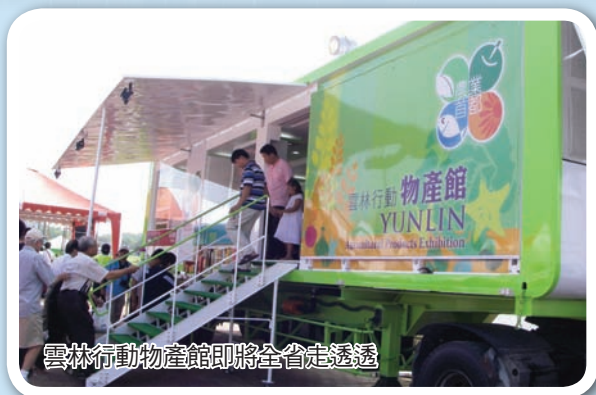
雲林行動物產館即將全省走透透