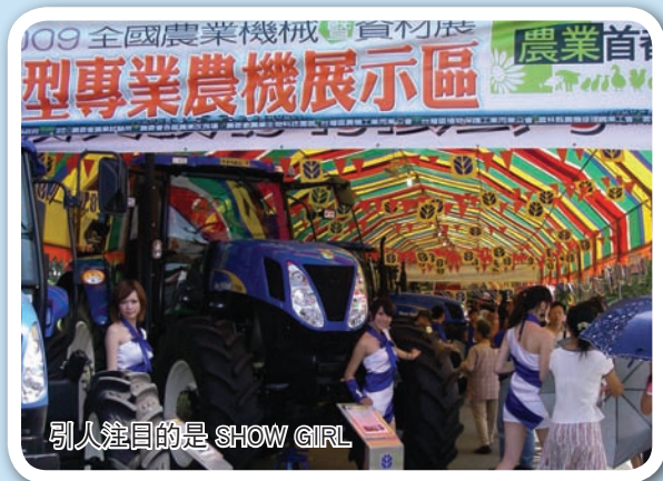
引人注意的是 SHOW GIRL

包括新型農機區、各式專業農機區、農業資材區、溫室設備及優質農產品區等，全場共有 171 家廠商展售，現場還安排滾動牧草堆、親子溜溜樂及 DIY 風箏教學等遊戲，讓來訪的民眾親身體驗農村生活。