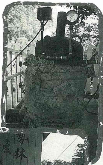
利用高溫蒸餾爐提煉樟腦油

東勢林場另外一種特產品，來自蜜蜂生態展示場。這裡飼養30箱左右的蜜蜂，以林場內的花蜜為食。每年冬天與春天，東勢林場花開最盛的季節，也就是蜜蜂採蜜最忙碌的時候。小朋友來參觀養蜂場，蜂主人會親切的教你如何辨識女王蜂，雄蜂不會叮人，可以抓回家去養；遊客有興趣的話，可以自己動手搖蜜，順便買幾瓶新鮮精純的蜂蜜或花粉，與家人親友分享。