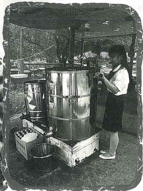
遊客自己動手搖蜜