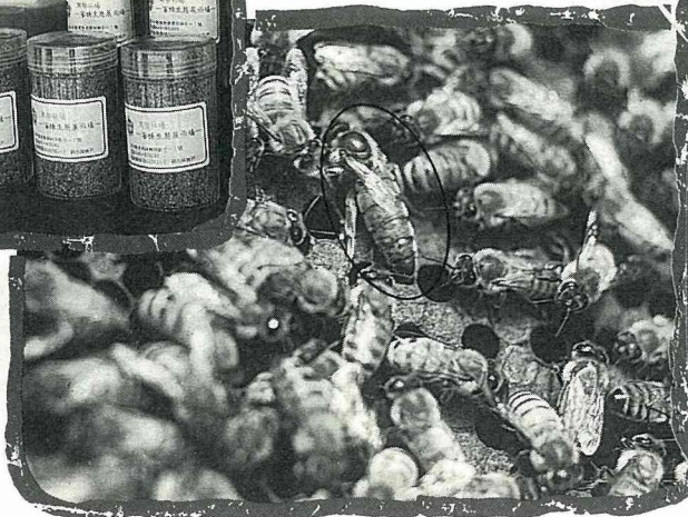
圖中央體型較長的就是女王蜂 ▲