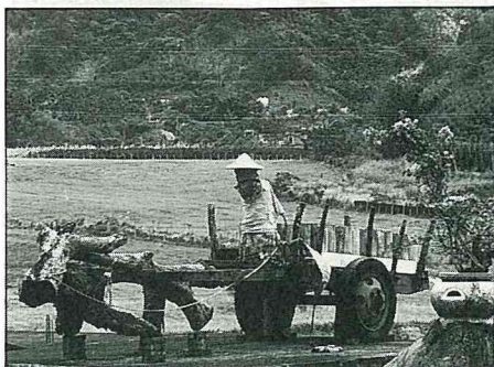
民俗公園內的“趕牛老農”