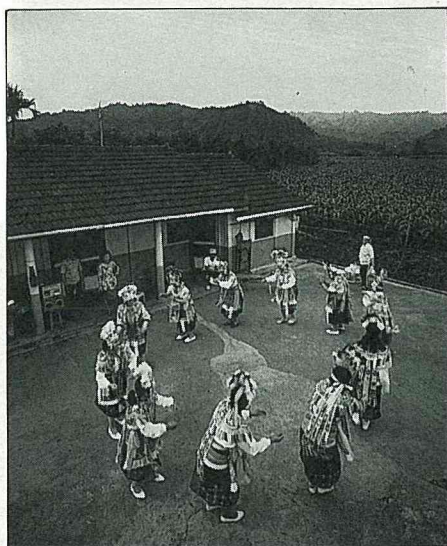
利吉社區的媽媽教室