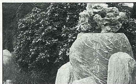
利吉社區的袖珍公園

國家14項重要建設“基層建設”項目內，而提出了“新山村”的計劃，以縮短山地與平地的生活差距。“新山村”計劃的內容，是每年選定4個全省“最為偏遠、落後的社區”，集中人力、物力，在一年之內加以改善，除軟體和硬體的建設，並從生活、環境、心理、倫理親情教育上，改善其舊有的觀念。