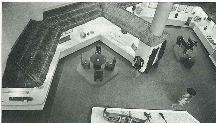
卑南文化文物展示館