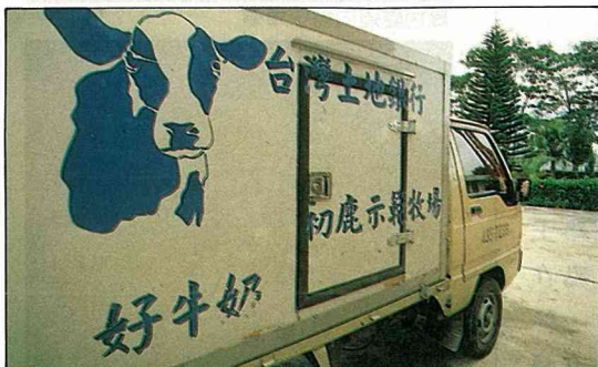
一車車初鹿鮮奶，運往各大都會。