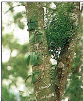
植回樹上的蘭花，是台東縣花。