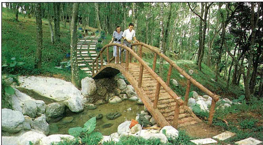
牧場樹林區的小橋流水，造型清純。 鄉間小路 第17卷·第28期