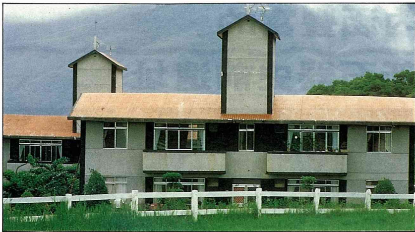
紅瓦白牆造型優雅的房舍