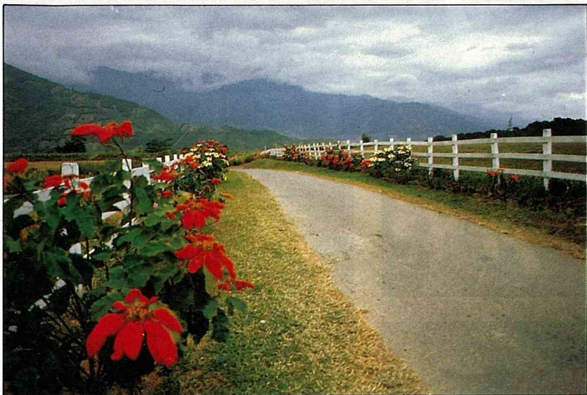
令人舒坦的開闊視野