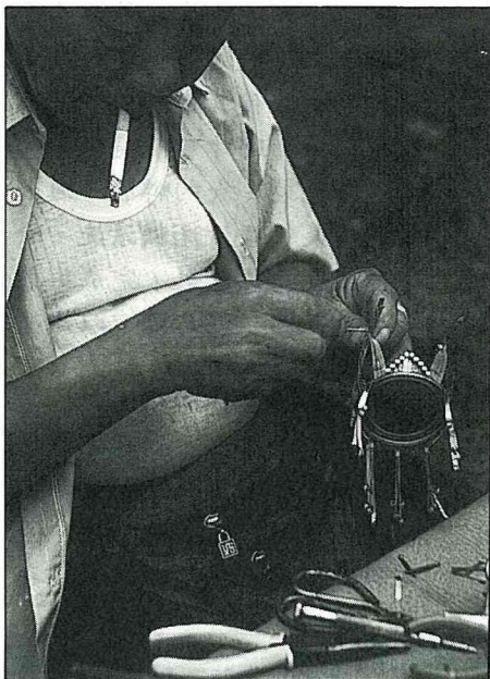
林樞表演手工工夫

他覺得很有意思，不但可以打發時間，又能交到新朋友，作品還能賣出，賺外快，受到遊客的讚賞，是他最感到欣慰的事啦！