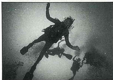
潛水賞景