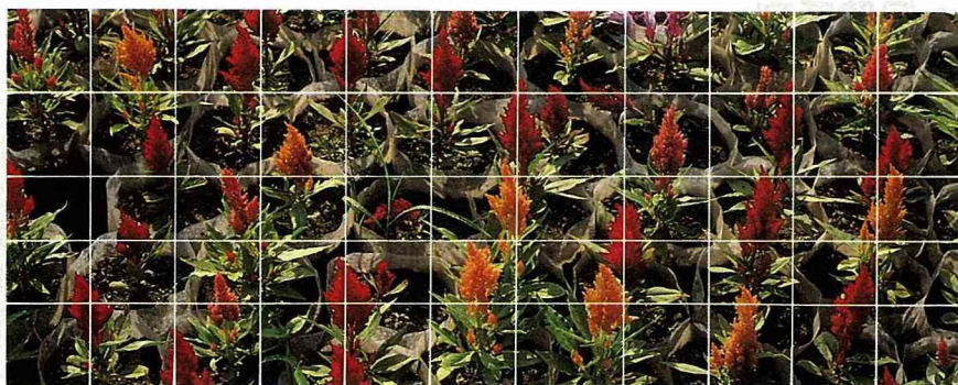
雞冠花耐熱、喜光照。

盆栽買回後，應將其清洗乾淨，除了植株上的枯枝、破損的葉片，開過的花梗須剪除，並須淋洗其上之灰塵、雜物等，盆子亦須以刷子清洗乾淨