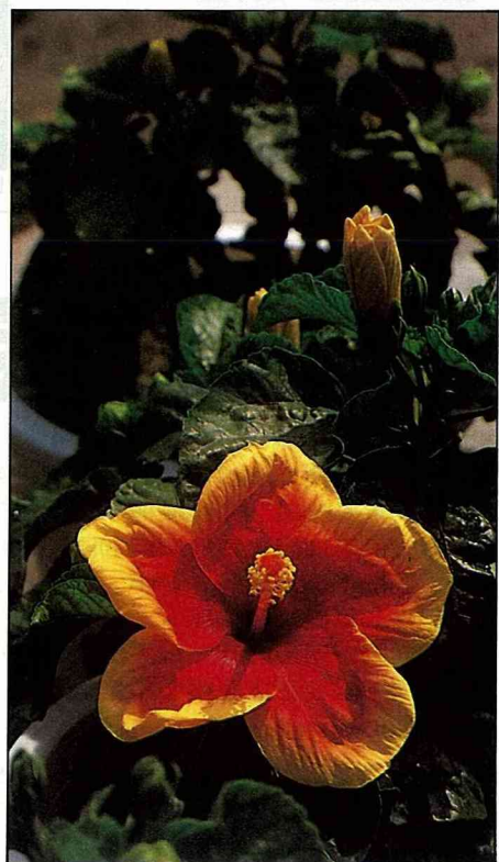
大花扶桑須置於光線明亮處。

作好這些處理，不論你是將其視為消耗品，即觀賞期後即予丟棄，或欲嘗試栽培，均可使植物更健康，延長其觀賞期，對日後的栽培過程亦會有很大的助益，因此在購入後別忘了先作好清洗及健化的工作。