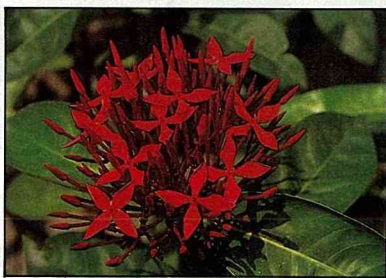
充足的光照可使仙丹維持花色艷麗。

，尤其是附有青苔的盆子，以保持葉片及根系的通風良好，葉片亦可以布或海棉沾水擦拭，或以噴霧器噴洒後，再以布或棉花拭去塵土。