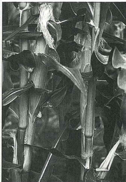
一株只留1~2穗果實，多餘的必須疏果。