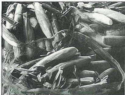
生長3個月即可採收上市。