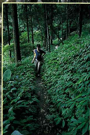
林相優美的柳杉林