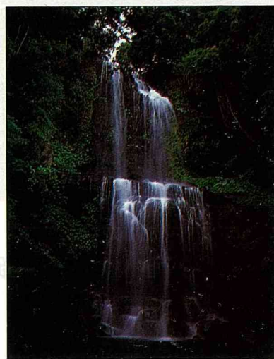
雲森瀑布氣勢不凡

柳杉造林——在陡峭的中海拔地區，為省林務局柳杉植林事業區，林相單純整齊一致，多位於熊空山海拔500～700公尺山區。