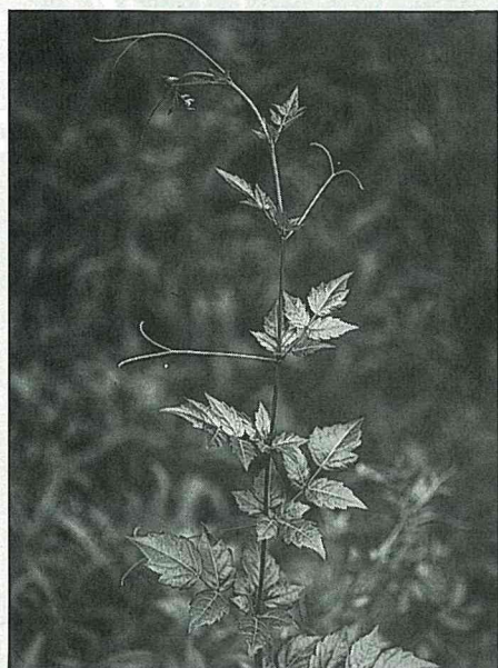
白茶其實是一種藤類植物

欣賞美麗的山林溪流勝境之餘，另一項最愉快的事，莫過於品嚐當地的特產了。三峽有木里在大豹產業道路沿線的農戶並不多，農產品產量也相對有限，但產物却精緻有特色，很值得遊客嘗試。