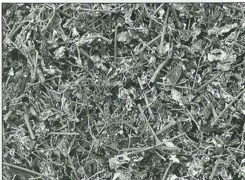
曬乾的白茶葉片呈現“潔白”

名“七葉參”、“五月茶”，據說有人參的效用。“白茶”，雖是一種飲用茶，却不是一般的茶葉，而是另一種藤類植物製成。製作過程是將嫩葉連枝剪下，切段曬乾後，葉面即呈現一片潔白，以此泡成的茶水，喝起來雖無一般茶種的清香，但三口之後保證喉頭甘美滑潤，令人愛不釋口。