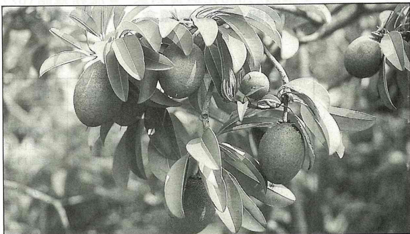
雲林、嘉義地區特產—人心果。

挑選已經軟化的果實， 用刀切成數片， 剝皮再食。 黃褐色果肉， 吃起來有砂質感覺， 很特別喔！