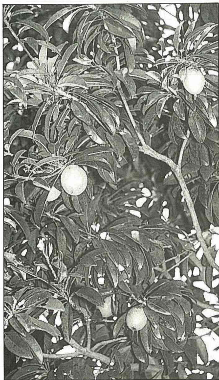
枝葉茂密亦可當庭園樹