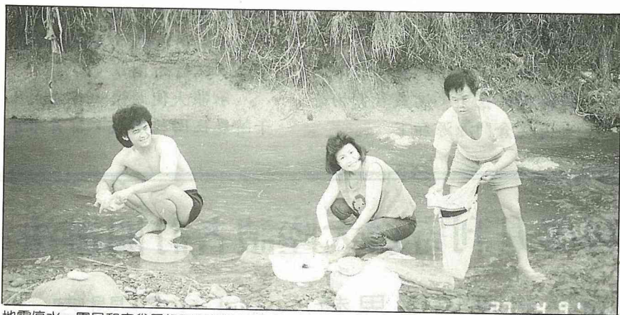
地震停水，團員和家眷只好到溪裡洗碗洗衣。

橋樑；自利蒙北上最嚴重的損害在巴丹到起立普（Chirripo）橋的一段；石油公司莫因煉油廠內油槽失火，燒毀部分油料和設備；莫因港至利蒙地層上升；運河中段有數百公尺已乾枯；馬迪拿（Matina）村落的房屋全部坍塌。