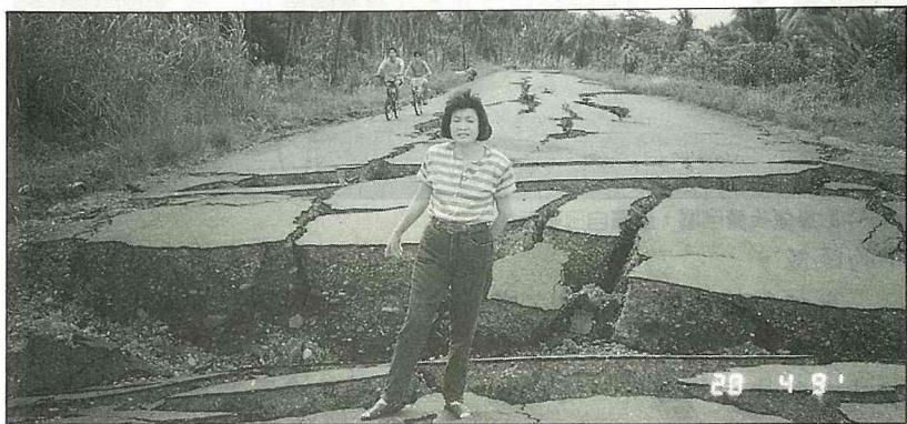
利蒙附近公路震成這樣