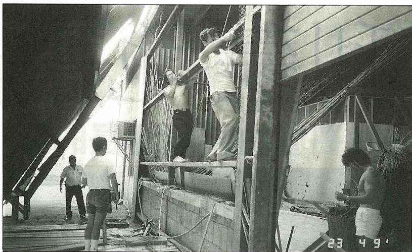
訓練中心後牆後簷倒塌，團員自己動手搶修。