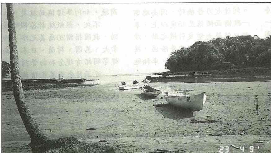
地層上升了1公尺，漁港變成陸地。