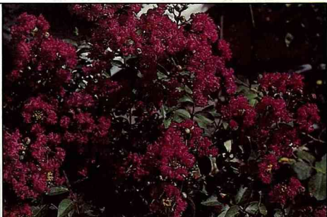
修剪紫薇可促進花芽產生。