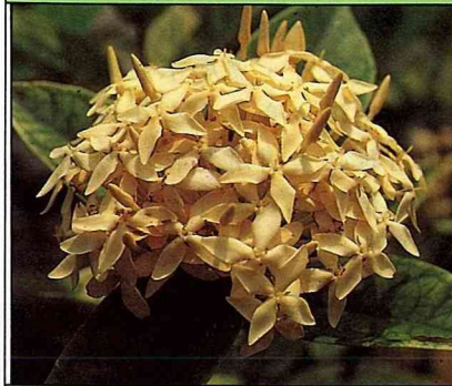
適當修剪可使黃仙丹成為美麗綠籬。