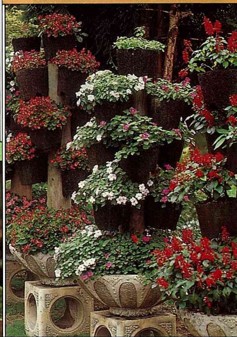
美麗的花鉢植物是細心照顧的成果。

以愉快的心情對待買回家的盆栽植物，每天撥出10分鐘看看它們，交換彼此的心情；一旦發現植物有異況，也可及早防除。