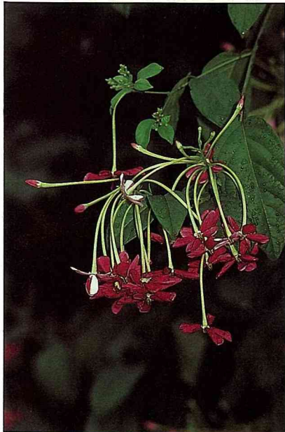
使君子蟲害多，宜注意防範。