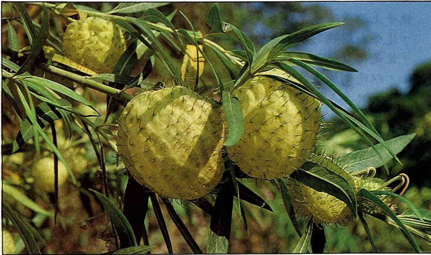
佈滿釘刺的果實氣鼓鼓的，裡面除了種子，空無一物。