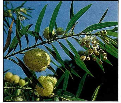
花與果並存枝頭的景觀。 色乳液，所以，應將乳汁洗淨後再扦插，可提高其成活率。