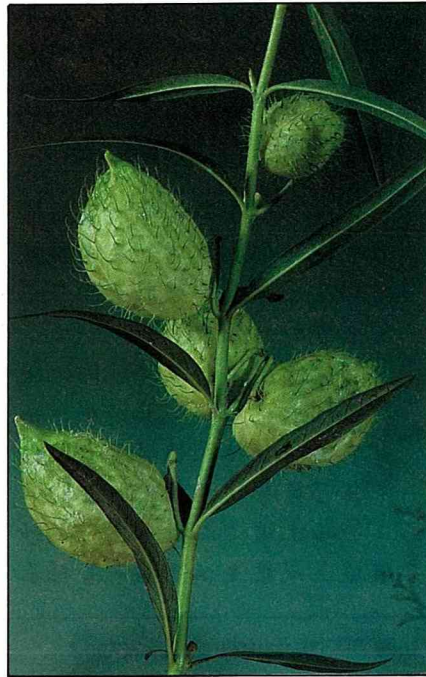
果實是切花的上等材料