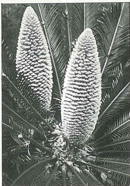
蘇鐵的雄花

鐵樹到底是怎樣的一種植物呢？它的真正學名叫“蘇鐵”，屬蘇鐵科，是最原始的種子植物之一，它的化石約有2億年歷史，多存於石炭紀及二層紀地層中，在現存種子植物