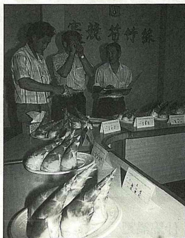
長治的綠竹筍每年都辦競賽

目前，長治鄉的綠竹筍已進入盛產期，平均每台斤60元的產地交易價格，使天未亮就忙著到竹園裏挖筍的筍農，暫時忘却辛勞，綻露笑容。