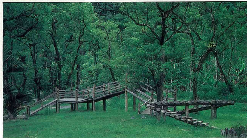
樟樹林下的體能設施