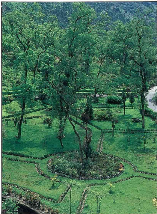
富源森林遊樂區規劃完善的樟樹森林浴場，以新貌迎人。

富源森林遊樂區地近花東縱谷公路，交通方便，可順道遊覽附近的風景據點，例如瑞穗溫泉、紅葉溫泉、舞鶴茶園、北迴歸線地標等。