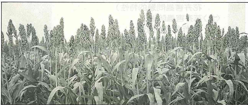
義竹鄉高粱栽培面積為全省之冠