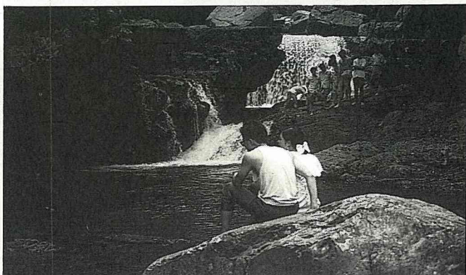
觀瀑戲水是滿月圓的一大特色