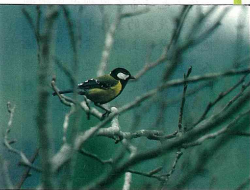
林間野鳥“青背山雀”