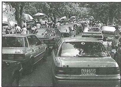
會場中，人車擠得水洩不通。