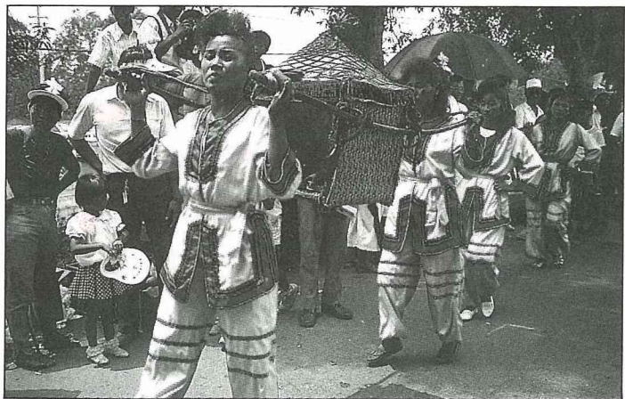
農民組成的陣頭之一