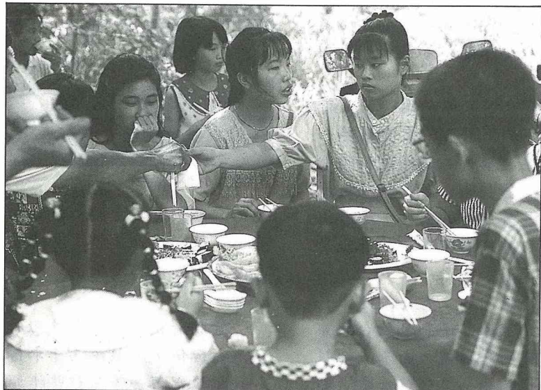
別開生面的芒果大餐