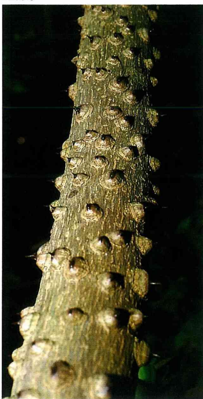
食茱萸樹幹上有瘤刺