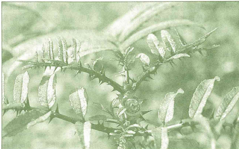
食茱萸嫩葉是不錯的野菜