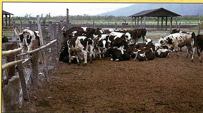
平林農牧場美景天成