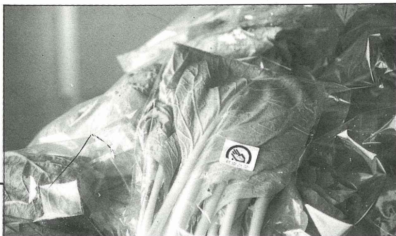
網室內栽培的祥安蔬菜

目前農會希望組織地方上四健會百餘位班員共同組織成立蔬菜專業班，以“祥安蔬菜”的標幟做共同商標，藉此凝聚大家的責任感和向心力，也讓消費者吃了新港鄉蔬菜，既“祥”和又“安”心。