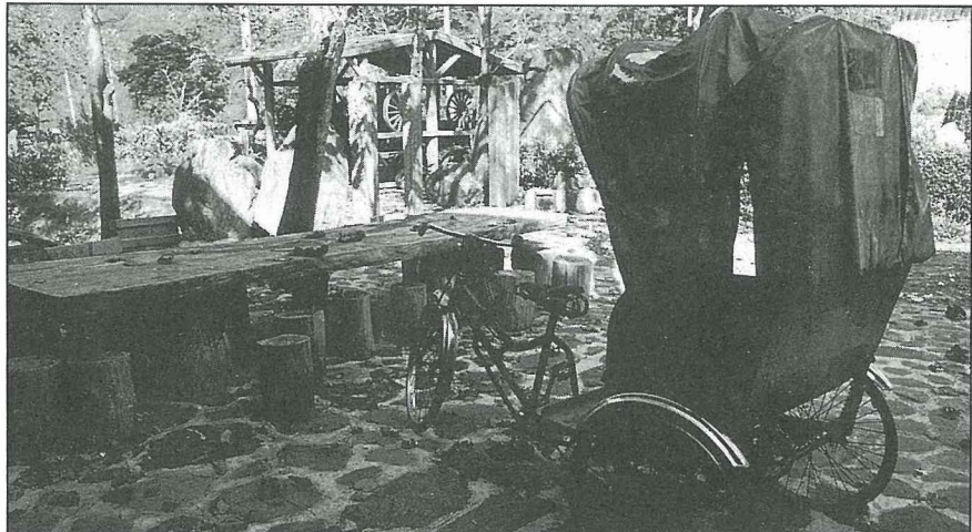
埔里傳統的人力三輪車

向陽博物館的地址：南投縣埔里鎮中山路一段19號（鳥踏坑），電話：(049)920233