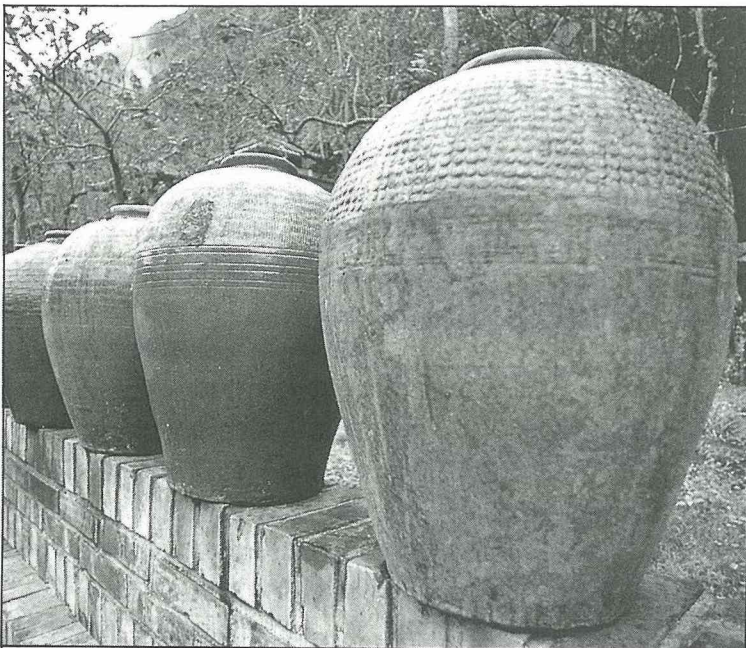
甕牆是博物館建築設計之一

山 清水秀、風光明媚的埔里，地處台灣地理中心，為一層巒疊翠的盆地，埔里先民筚路藍縷，開啓山林，奠定基業，始有今日繁榮景象，先民披荆斬棘，刻苦經營，其開發歷程與社會變遷，實為台灣史的縮影，舉凡此地的開拓與發展：從邊疆政治、社會體系、文化傳遞、宗教民俗等，皆可呈現台灣歷史發展的軌跡與脈動，而多元民族所融匯的文化資源，堪為考古學、人類學、民族學、歷史學、社會學、美術工藝學的學術寶庫。為保存此地豐碩的人文景觀，規劃未來文化產業的發展模式，結合埔里天然景緻，以休閒與文化相承的前瞻性鄉土文化展示空間，向陽博物館於焉成立，獻給先民及為這塊芬芳土地付出心血耕耘的人們，以期鄉土文化落實本土。