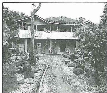
深處鄉間的林淵工作室