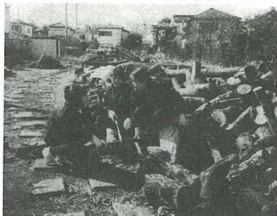
日本中央中學學生練習窯燒木炭

隔天，學生們將炭裝在網狀的袋中，堆在三輪車子上，沿著河岸一面走一面將炭丟入河川中。3~4個月過後，鄰近的媽媽們皆讚不絕口：“真