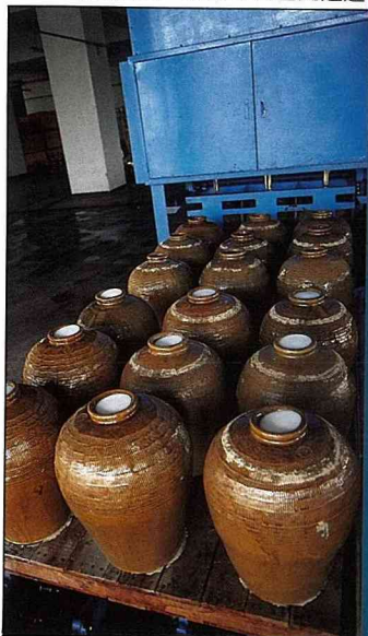
埔里氣候，冬不嚴寒夏無酷暑