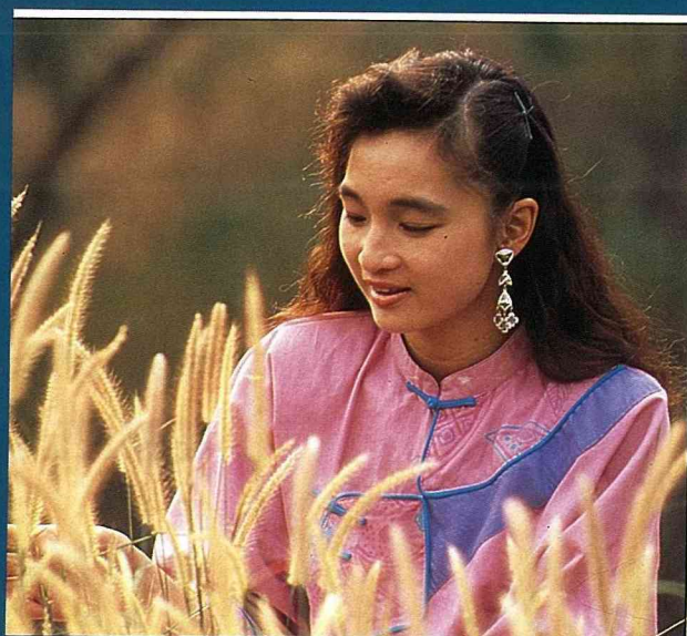
埔里水質，自然清甜軟硬適中