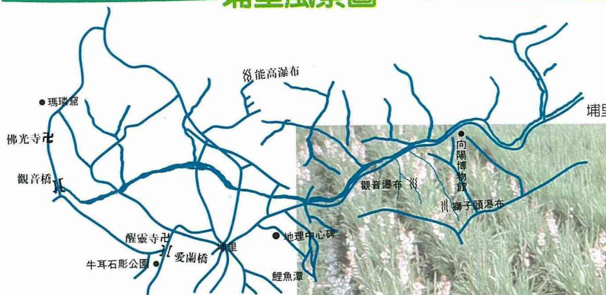
埔里花卉直追彰化田尾(圖為水田中的唐菖蒲)