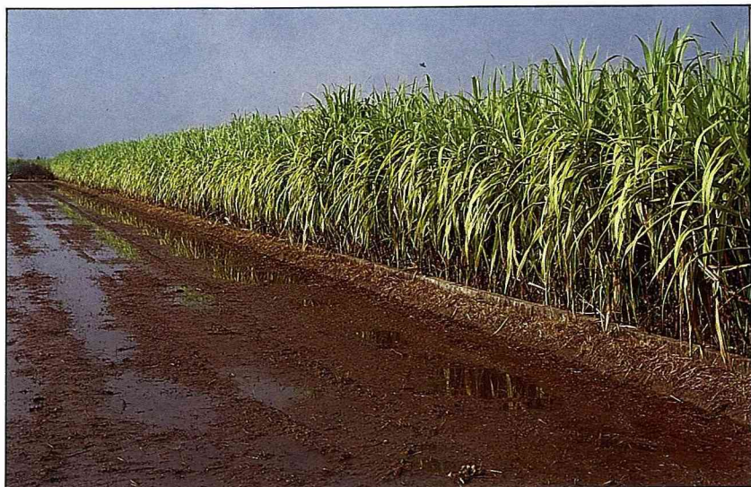
埔里紅甘蔗大大有名

除了菊花，還有康乃馨、玫瑰、滿天星、聖誕紅、非洲菊，及新近的國蘭、洋蘭栽培，在蜈蚣里一帶，但見花園、園藝設施一處處，置身其中，宛若花花世界。