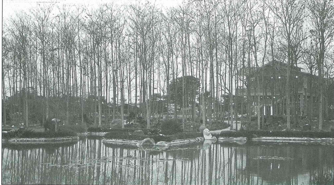
葉落梧桐林，蕭瑟之美