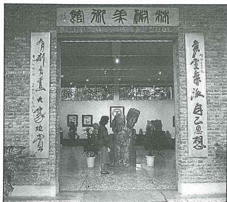
美術館大門口的趣味對聯