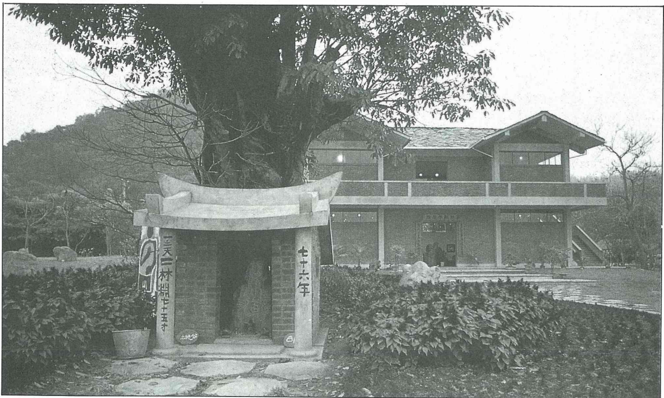
公園內有座土地公廟