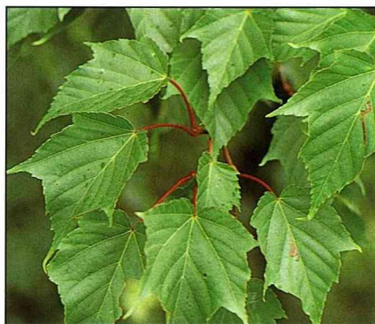
登高山時，別忘了欣賞台灣紅榨槭。

此樹種在平地燠熱處難以適存，上山倒不難見到，它生性強健，生長快速，在生育環境惡劣處亦可生長，繁殖以播種即可。