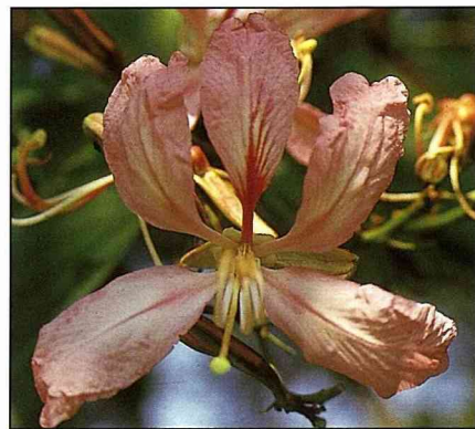
洋紫荊在12月間盛花滿樹