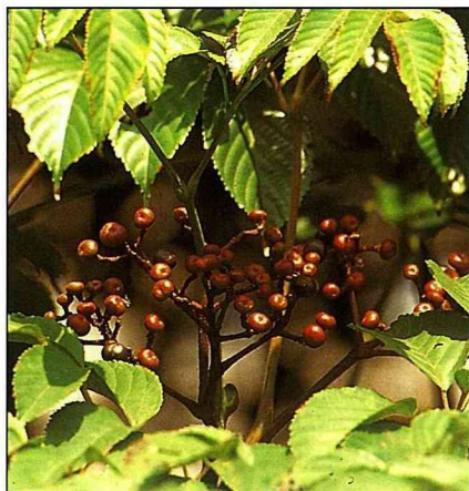
火筒樹的暗紅果實

本種生性極強健，生長快速，全省由南至北，平地至中海拔均可種植，觀花、觀果價值均各具特色。