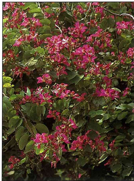
艷紫荊盛花時，如盛粧的艷婦。

在台灣平地由北至南均見栽培，而且都生長得很好，少見病虫害，是相當值得推廣的觀賞植物。