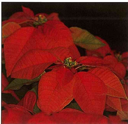
聖誕花泛紅時，年尾的脚步近了。