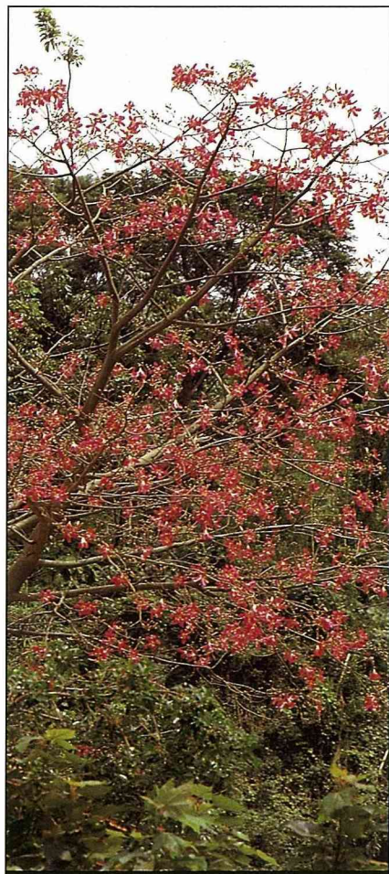
盛花的美人樹，只見紅花不見綠葉。

鵝掌藤適全省各處栽培，照顧管理相當容易，可以修剪方式促其矮化，植株呈高腳狀時亦可予以強剪。一般均以扦插法繁殖。