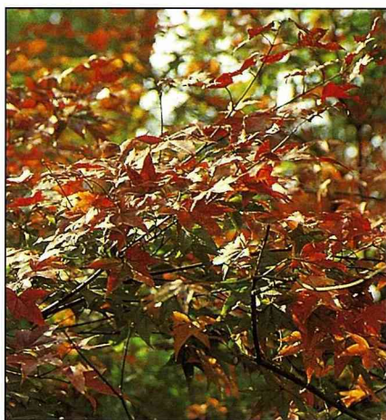
台灣掌葉槭染紅了山區

此植物比較適合平地庭園中栽培，但燠熱的南部栽培，生長不如北部，若在中海拔的山區栽培則生長更好，而且冬天可以欣賞紅葉；台灣南部平地要欣賞紅葉，是不太可能的事。