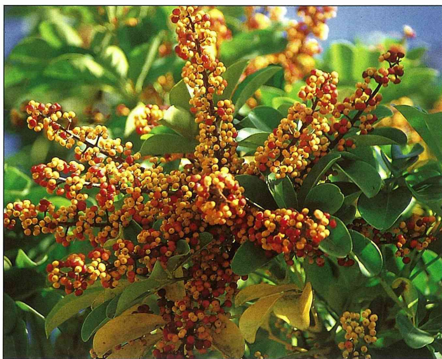
鵝掌藤為數眾多的亮麗小果

春天結果，果實大如拳頭，成熟開裂後，露出黑色密被白綿毛的種子，可播種繁殖，發芽率極高，可自行採種一試；另亦可用扦插法繁殖，並可提早開花。