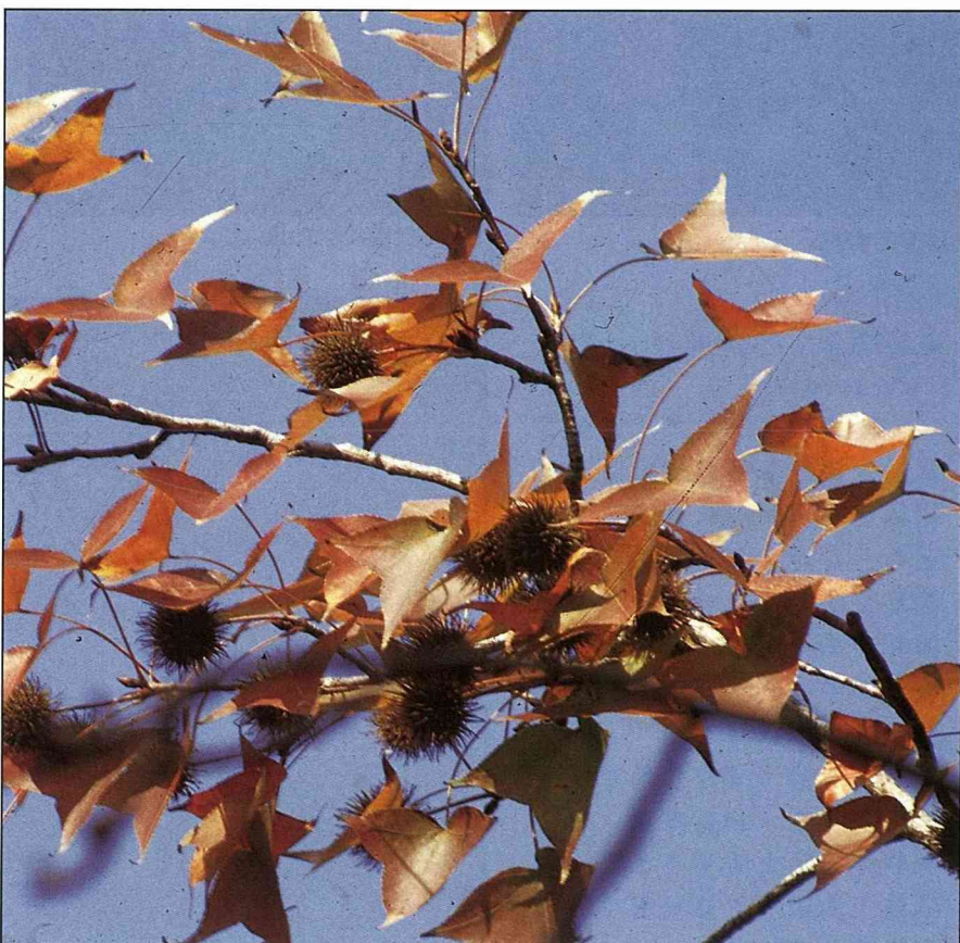
換粧的季節，楓香的葉子變了色彩。

適全省平地栽植，亦有在都市中植為行道樹者，但不耐山區冷涼（3℃以下）的氣候。壽命頗長，日本亦曾引進栽植，為數不少。繁殖採播種法。