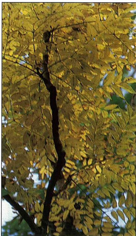
台灣欒樹落葉前，一片耀眼的金黃。

此陽性樹，生長快速，多用播種繁殖，亦可用扦插法。它生性強健，未曾見病虫害，抗空氣污染，適種全省由北至南，由都市至山區，適應上都没有問題，只要不種在陰暗處，生長易，管理工作不多。