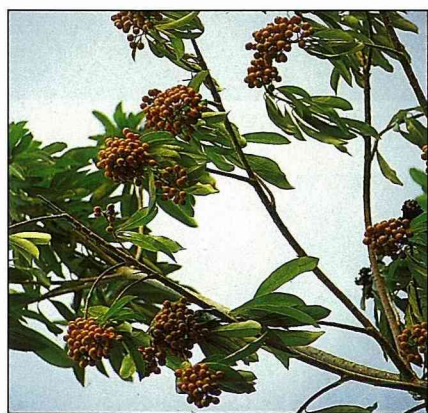
台灣海桐小黃橙果，團聚成球。

庭園中現亦見此樹被修剪成灌木狀，或栽成連續性綠籬，既可觀花、觀果，又是香花植物，應用特性多方面。用種子播種來繁殖，並不困難。