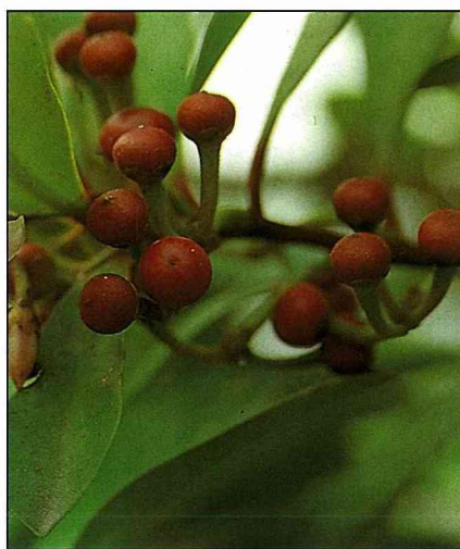
春不老的果實由淺綠轉紅再轉紫紅，變化豐富。

陽性樹，耐性強韌，却不甚耐寒，自北至南的平地栽培都不成問題，是庭園中常用的綠籬材料。台灣的蘭嶼與綠島有原生種的春不老。繁殖可用扦插或分株。