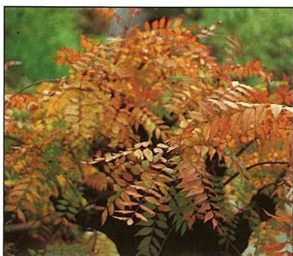
黃連木落葉前，葉色美得令人暈眩。

此種適合全省由低海拔至中海拔處種植，都市中（台北市中山北路）也有植為行道樹者，因樹型完整，又具遮陰性，春來可觀賞其紅嫩的新葉，至落葉前又有一番新面貌。雖偶有病虫害侵襲，破壞葉片的翠綠與完整，但幸好是落葉樹，每到新春又可煥然一新。◆