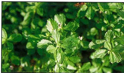
失戀藥草配方須混合17種藥草