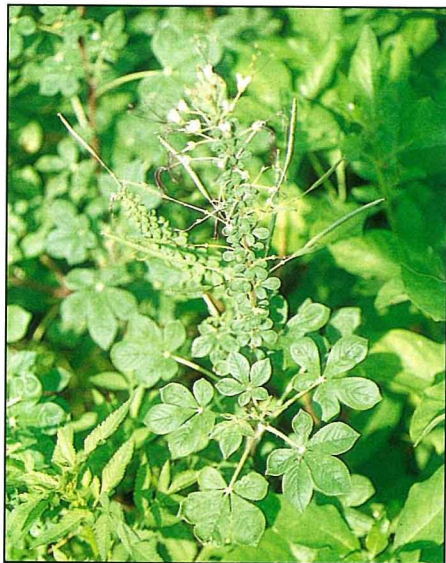
失戀藥草良藥苦口，但總比吃香蕉皮好。