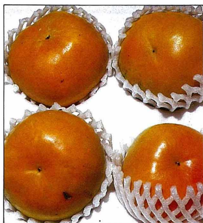
以個體重量分級包裝