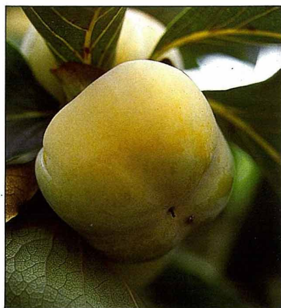
四周柿脫澀成爲紅柿

每 逢秋季來臨時，正是柿紅時節，台灣的山區都有柿子的踪影。本省柿子以牛心柿、四周柿最多了，牛心柿和四周柿都屬於澀柿類，必須加以脫澀處理，方能食用。四周柿可脫澀成市面上的紅柿，或做成柿餅；牛心柿則以石灰水浸泡脫澀成水柿，以嘉義番路鄉產量最多。