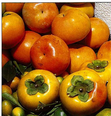
日本甜柿試種成功