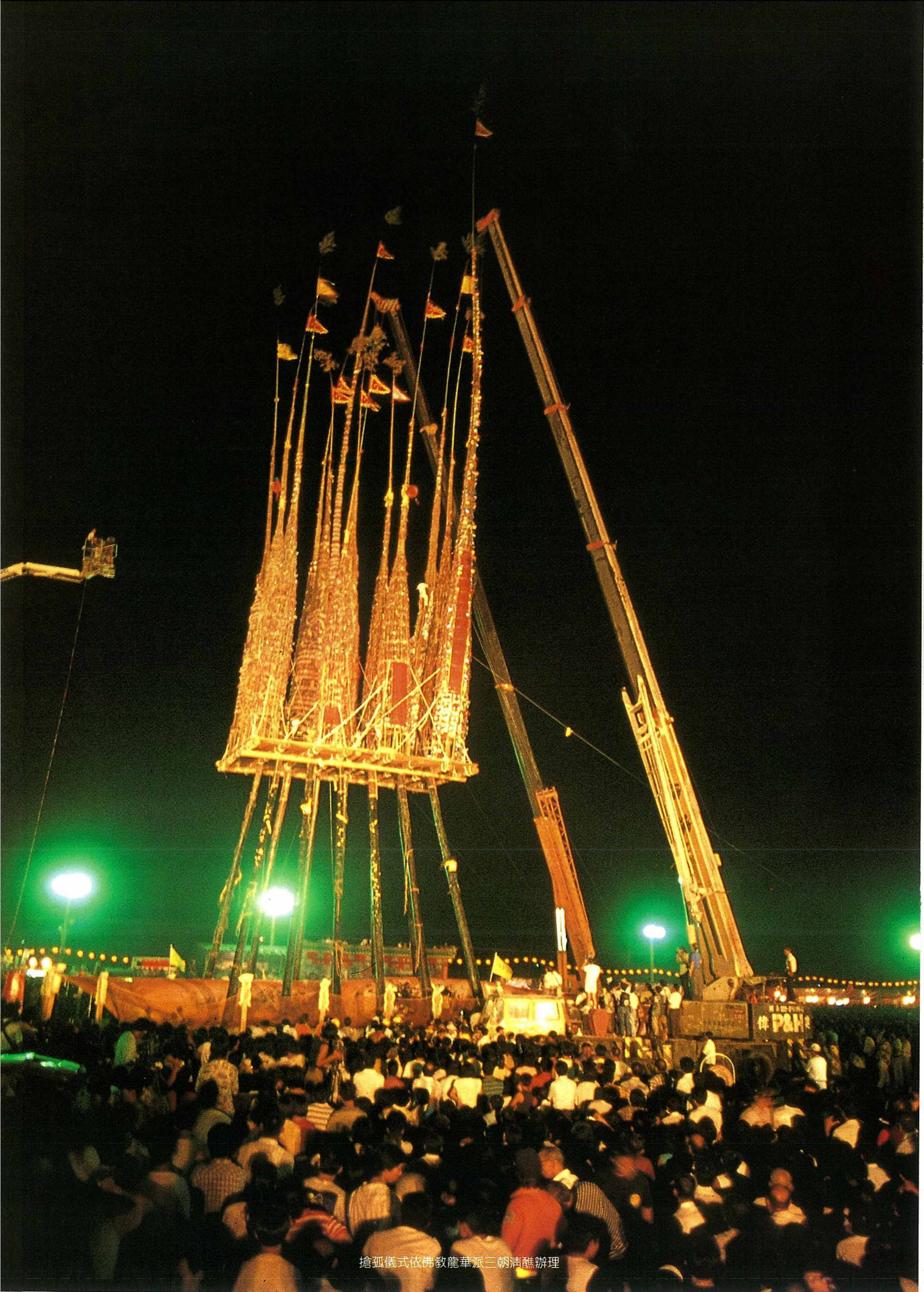
搶孤儀式依佛教龍華派三朝清醮辦理