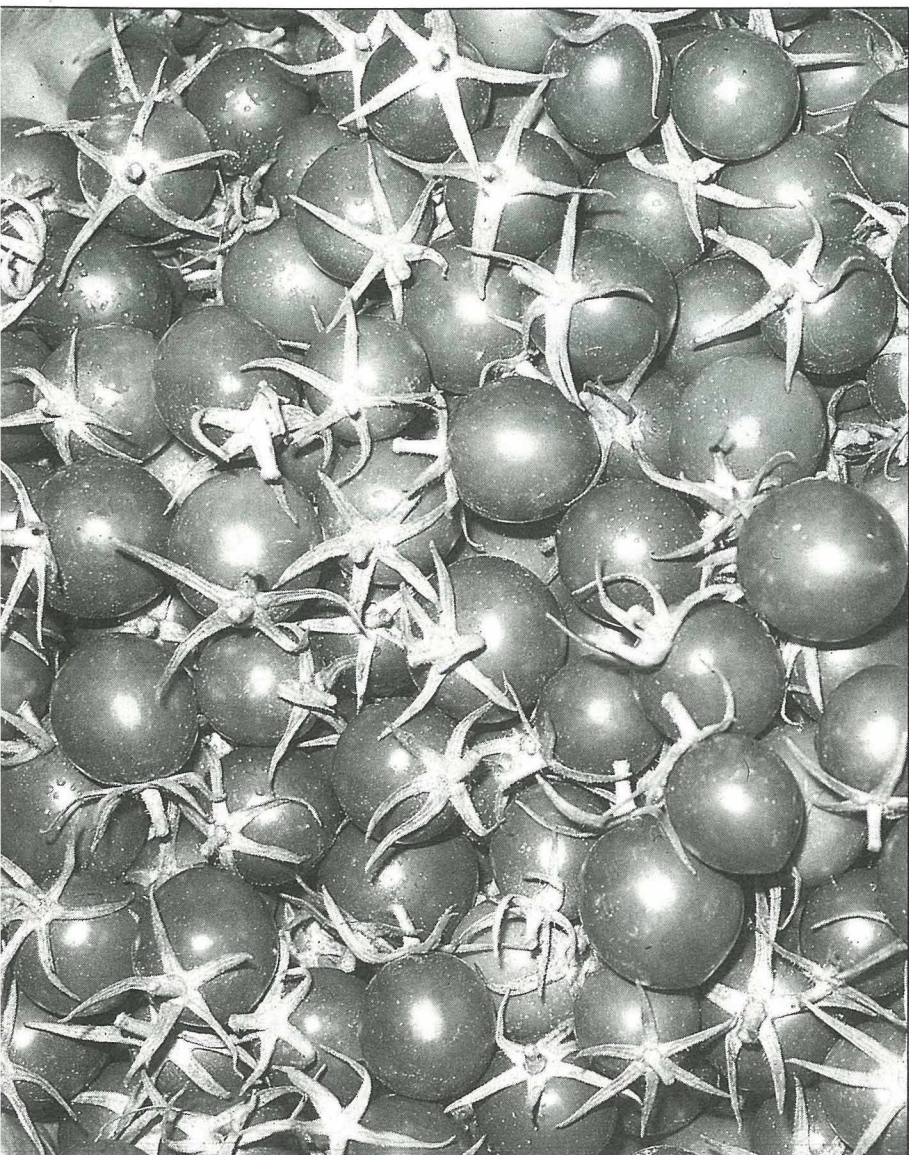
小金甘番茄是台南縣特產