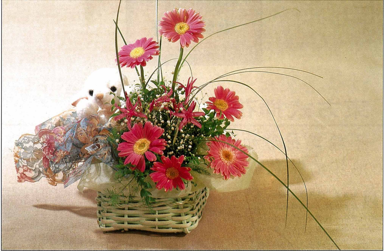
亮麗的花藝禮品(花藝設計／范姜素篤)