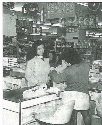
台灣大量使用塑膠袋，可曾擬妥塑膠垃圾解決之道？

，他們必須付錢買塑膠袋，所以民眾大都自備塑膠袋或者帶籃子來購買東西，你看我們的環境不是乾淨清爽多了嗎？