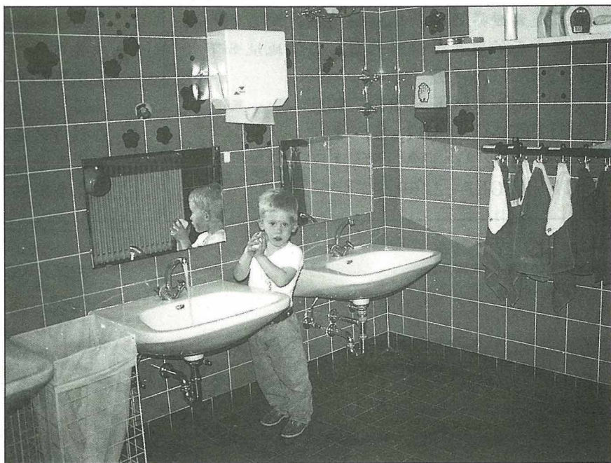
廁所漱洗設備完全配合幼兒來設計。每人有2套貼上名字的漱洗用具；回家前洗淨手臉，將毛巾丟進洗手檯旁邊的污物袋內，由園方集中處理，洗淨消毒後再掛回原處。