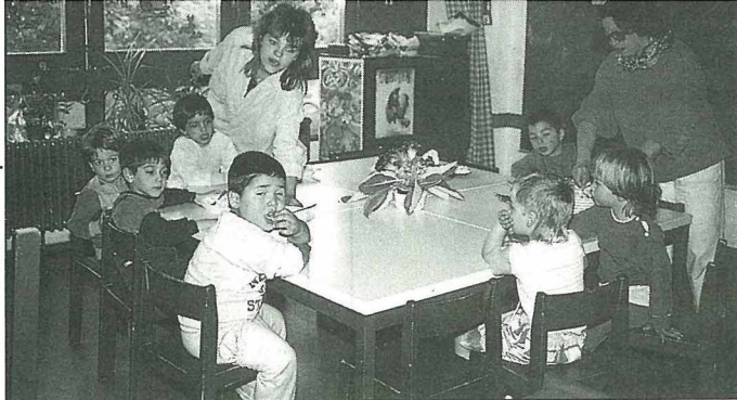
快樂的午餐時間，桌上的盆栽鮮花是從院子拿進來的。

深秋、寒冬，活動重心在於戶內之遊戲大廳。適當之韻律體操與舞蹈、積木、畫圖、剪貼、摺紙、黏土彫塑等美勞活動。