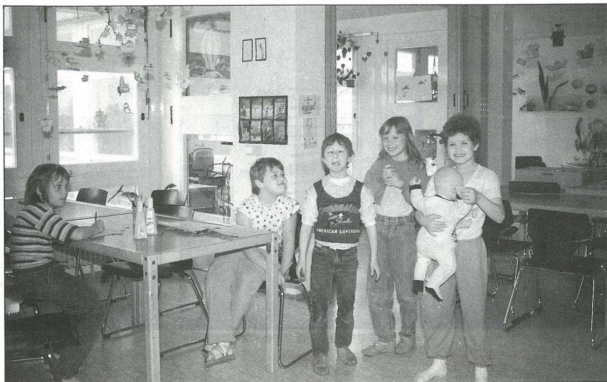
老師指導兒童照顧嬰兒，成為媽媽的好幫手，不致因新生嬰兒的來臨，產生失落感，而欺負弟妹。