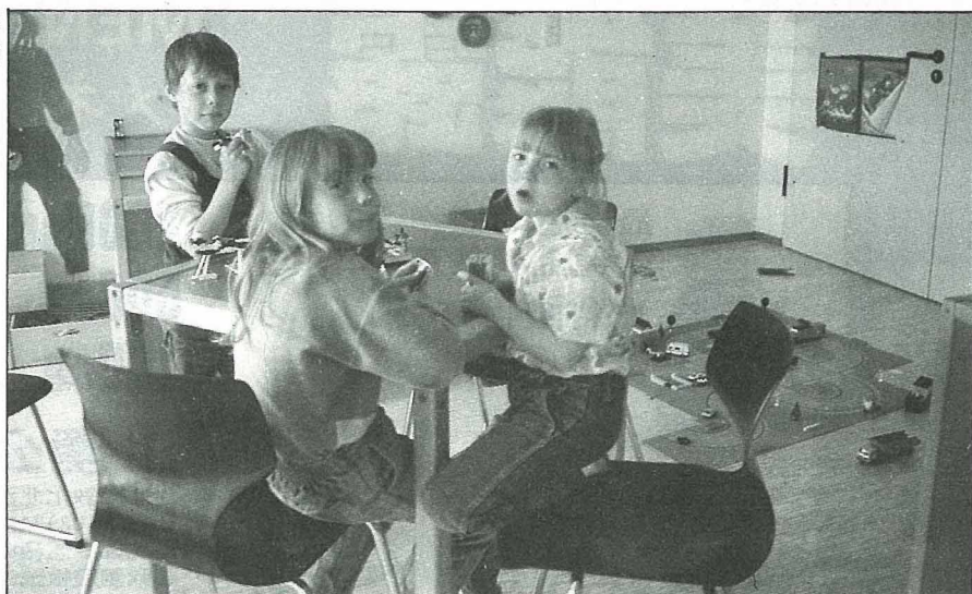
德國的托兒所與幼稚園採用混齡的家庭生活教育

德國民法規定在德國地區居住者，子女5歲以前必須雙親之一留在家中負起教養工作，除非有特殊狀況諸如家庭變故之單親家庭，或雙親身體狀況不適於擔任教養工作等等，則由國家負起學前教養工作，設立托兒所及幼兒園。