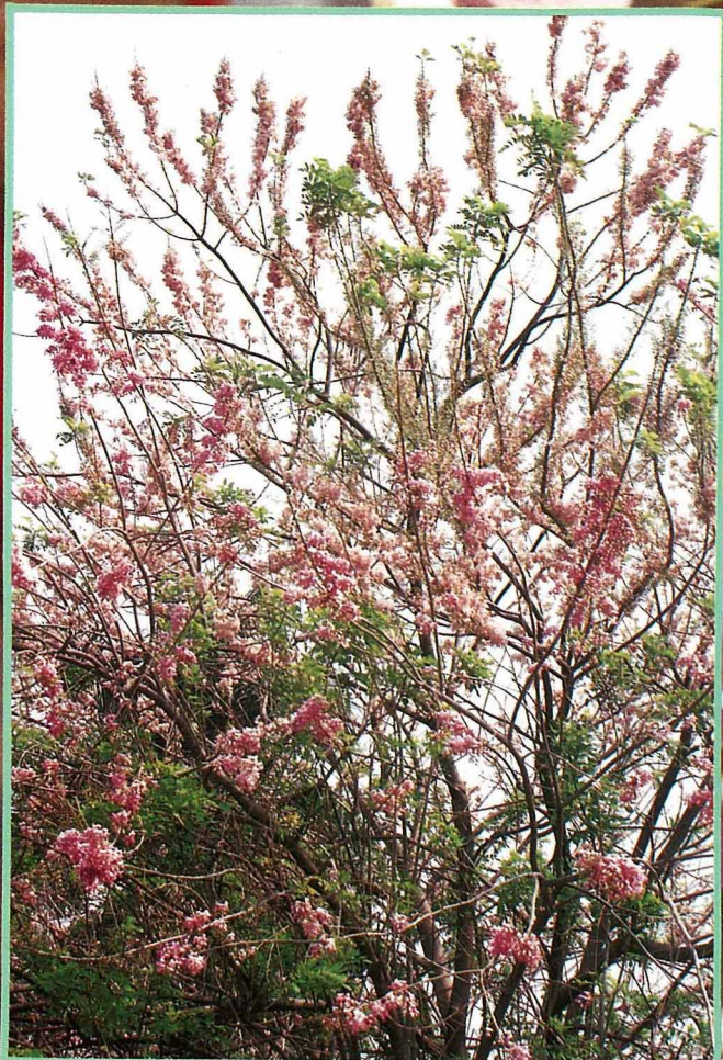
來自宏都拉斯美麗的綠籬植物。