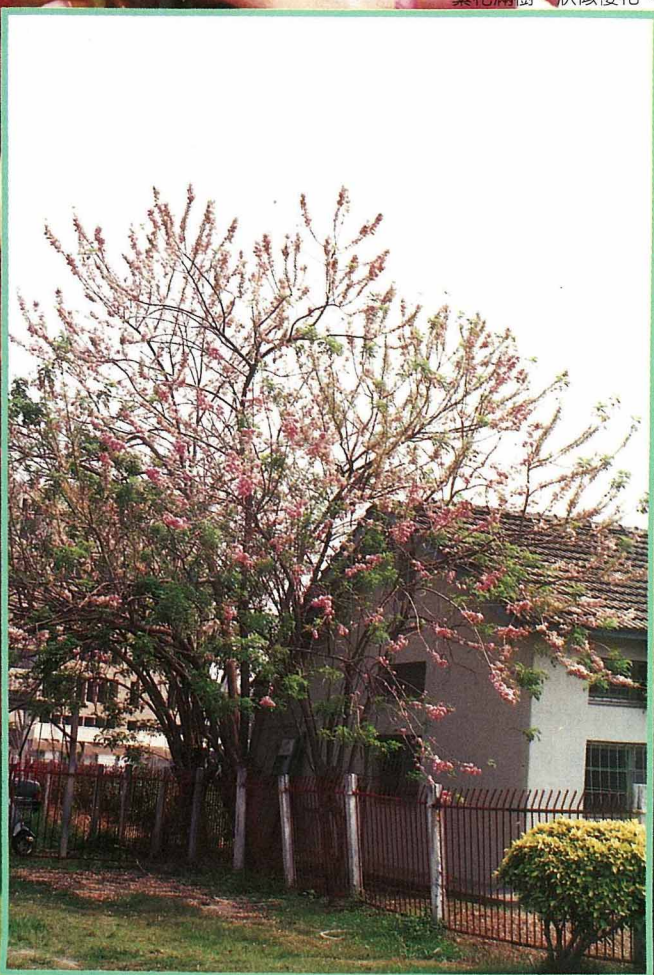
南洋學又稱毒鼠木，花色美，但種子有毒。