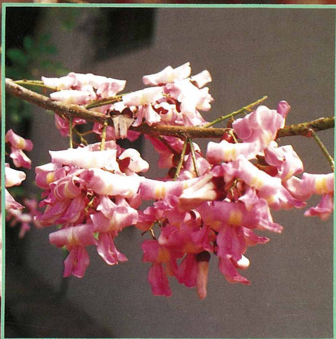
繁花滿樹，狀似櫻花。