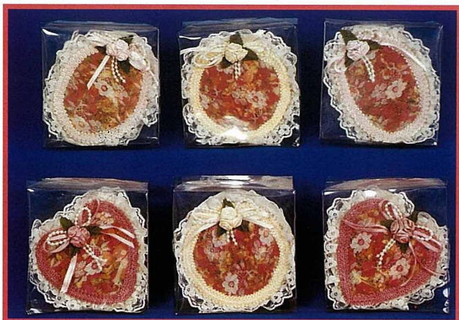
日本市場十分看好的香花子吊飾。