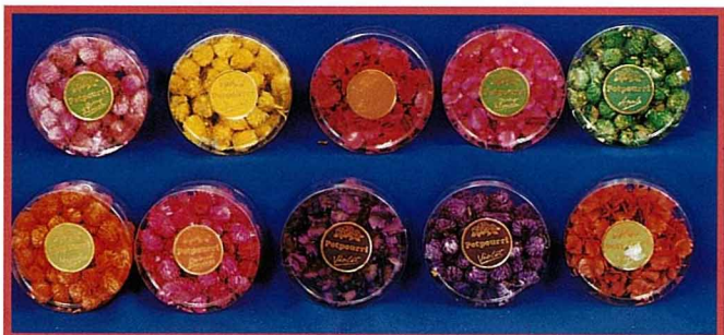
經染色附香裝在透明盒子裡的香花子，暢銷美國。