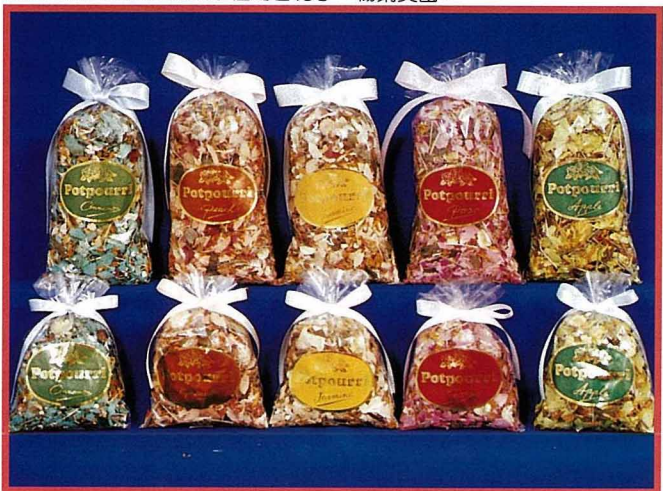
花草碎片混合木屑的香花子產品，朝歐市進軍。