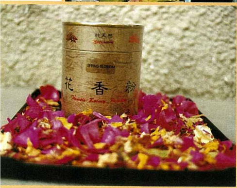
燃燒聞香用的花香粉，是花瓣葉片的碎屑研磨而成。